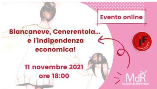
Evento 11 novembre sull'indipendenza economica femminile

L'appuntamento "Biancaneve, Cenerentola... e l'indipendenza economica!" è in programma giovedì 11 novembre alle ore 18 sia online che in presenza al Museo