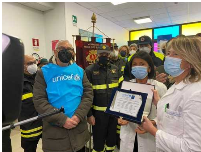
Un'edizione speciale del Gioco dell'Oca in dono per i pazienti del Regina Margherita e di Casa UGI

L'Unicef, in collaborazione col Museo del Risparmio, offre il laboratorio didattico "Io no che non ci casco" sviluppato dal Museo del Risparmio con la collaborazione della Direzione Cybersecurity di Intesa Sanpaolo