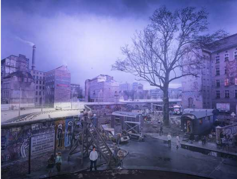
Tommaso Bonaventura, da 100 marchi - Berlino 2019, 2019