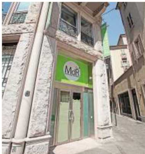
L'ingresso del museo