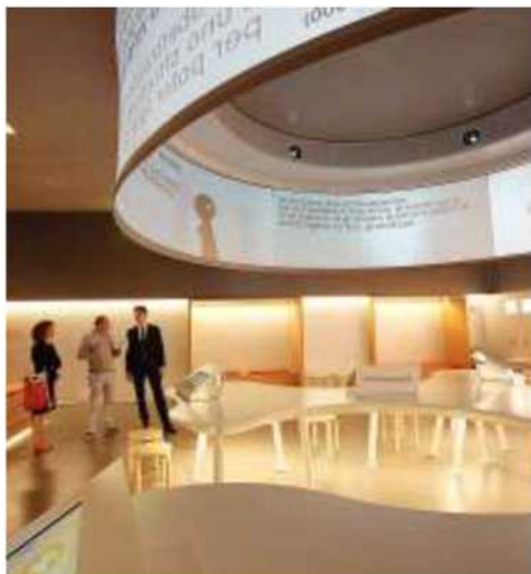
Isole «video» per approfondimenti